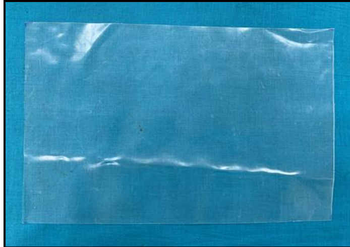
Photograph of the Specimen as in received condition

Discipline: Mechanical Product Groups: Rubber and Rubber Products