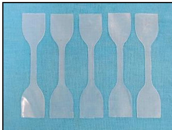
Photographs of the Prepared Specimens

Test Name: Tensile strength Test Method: ISO 37 Pre-conditioning: Temperature 23\pm 2^{\circ}\text{C} & 50\pm 5\% RH for 16 hrs. Laboratory Condition: Temperature 23\pm 2^{\circ}\text{C} & 50\pm 5\% RH Specimen type: Type 1 Test Condition: Gauge Length – 25 mm Test Speed – 250 mm/min.